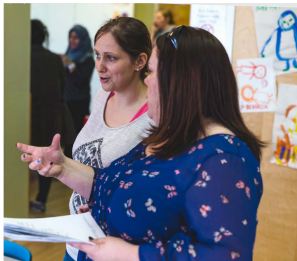
Deux collègues en train de discuter

Il est important que les EPEI employés comme superviseurs comprennent qu'ils peuvent être tenus de répondre à des attentes plus élevées, y compris de la part des familles, de leurs collègues et de l'Ordre, compte tenu de leurs fonctions officielles de supervision.