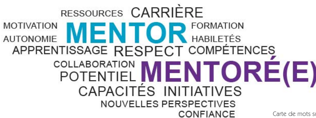
Carte de mots sur le mentorat