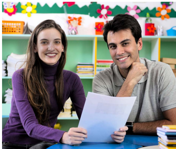
Deux collègues dans un milieu d'apprentissage pour les jeunes enfants

Les principales responsabilités de tout EPEI assurant la supervision professionnelle d'une personne sont les suivantes :