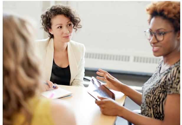
Collègues qui travaillent ensemble

Les EPEI occupent des postes de confiance et de responsabilité, non seulement auprès des enfants placés sous leur surveillance professionnelle, mais aussi auprès des personnes qu'ils supervisent. De nombreux EPEI travaillant dans des fonctions et des contextes variés assurent la supervision professionnelle de personnes supervisées , de sorte que cette note de pratique peut s'appliquer à tous les EPEI.