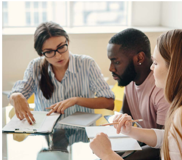
Collègues en réunion

Le niveau de supervision dépendra également du contexte au sein du milieu de travail. En la matière, les EPEI exercent leur jugement professionnel (par ex., accompagnement progressif, par échafaudage) pour déterminer ce dont une personne supervisée a besoin.